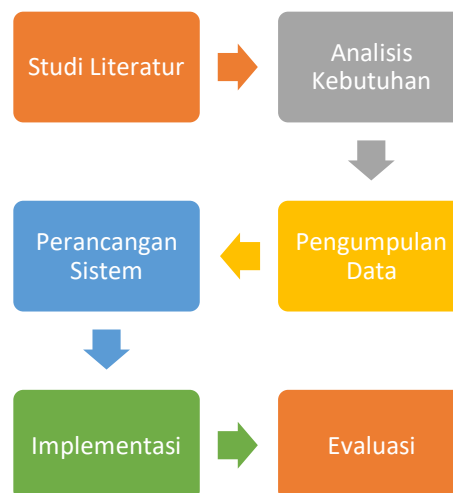
Gambar 1. Alur Penelitian

Penelitian ini menggunakan pendekatan kuantitatif eksperimental dengan model pengembangan sistem berbasis mobile yang diintegrasikan dengan algoritma Ant Colony Optimization (ACO) . Penelitian diarahkan untuk menghasilkan model optimasi penentuan lokasi layanan laundry yang mengacu pada parameter jarak, waktu tempuh, dan ketersediaan layanan.